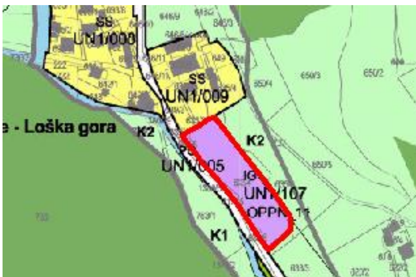
Slika 1: Z rdečo obrobo prikazano območje, ki je predmet spremembe SD OPN