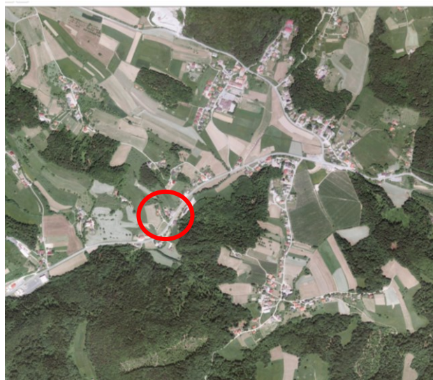
Slika 3: širši prikaz v prostoru – digitalni ortofoto posnetek