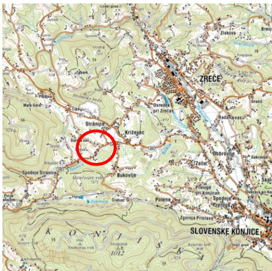
Slika 2: širši prikaz v prostoru – topografija